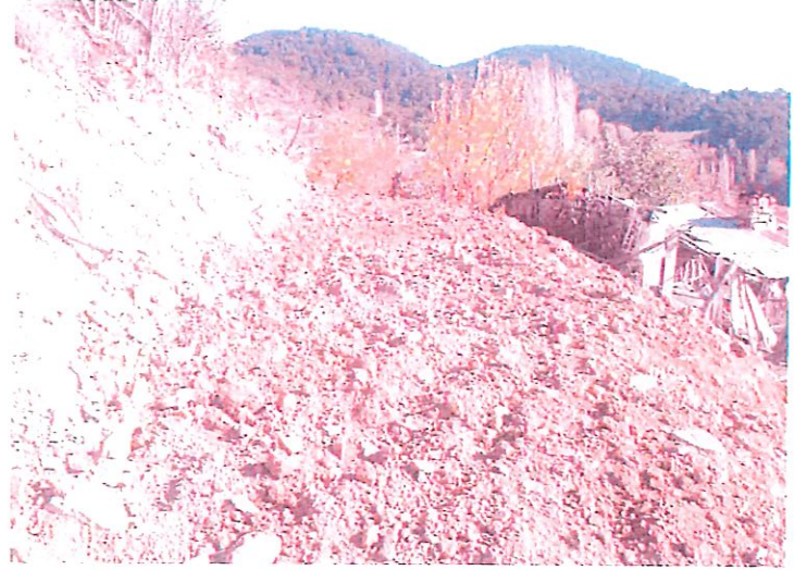
Foto:5-6 Kaya Islahı yapılan alandan ve yapılan çalışmalardan görüntüler.