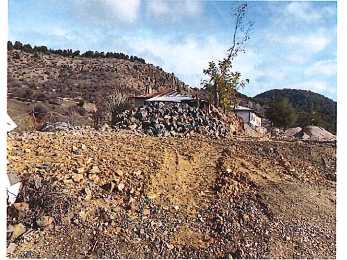
Foto :1-2-3-4 Sahanın ıslah çalışmalarından sonraki görüntüleri.

Bu nedenle; 14.01.2019 tarihli jeolojik etüt rapor ekli paftada sınırları belirlenmiş alan için Cumhurbaşkanlığı Kararnamesi ile alınmış olan 26.06.2019 tarih ve 1229 sayılı Afete Maruz Bölge kararının (Yapı ve İkamete Yasaklanmış Afet Bölgesi) kararname kapsamından çıkarılması uygun olacaktır.